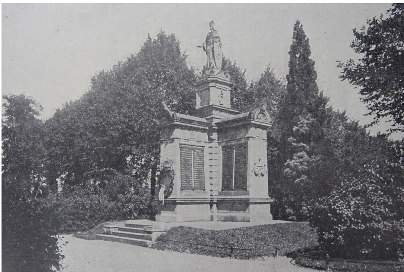
Kriegerdenkmal und Soldaten-Grabmal von 1870/71 auf dem Kölner Melatenfriedhof, um 1897