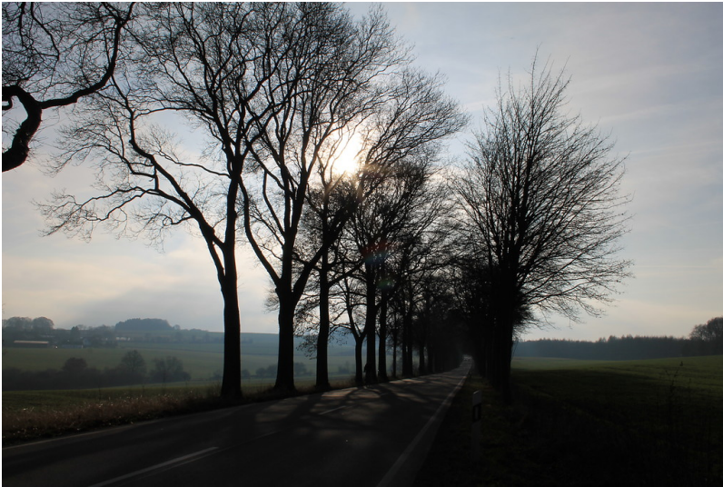
Schwelmer Straße (2016).