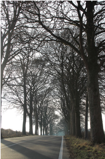
Schwelmer Straße (2016).