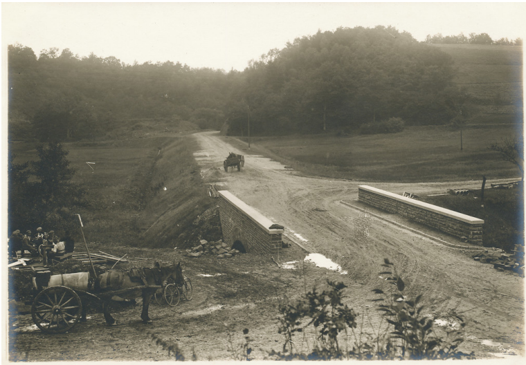
Wahnbachtalstraße während der Bauphase 1925-1927. Blick auf eine Brücke und den anschließenden Straßendamm, der noch nicht fertig gestellt ist.