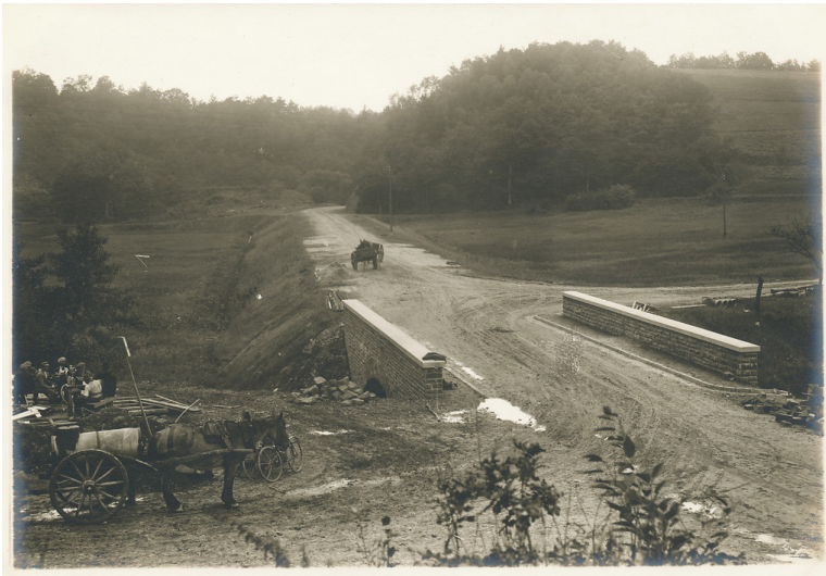
Wahnbachtalstraße während der Bauphase 1925-1927. Blick auf eine Brücke und den anschließenden Straßendamm, der noch nicht fertig gestellt ist.