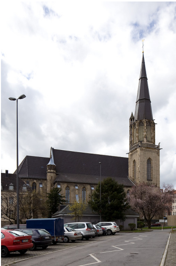
Aachen, Kath. Pfarrkirche St. Elisabeth