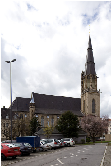
Aachen, Kath. Pfarrkirche St. Elisabeth