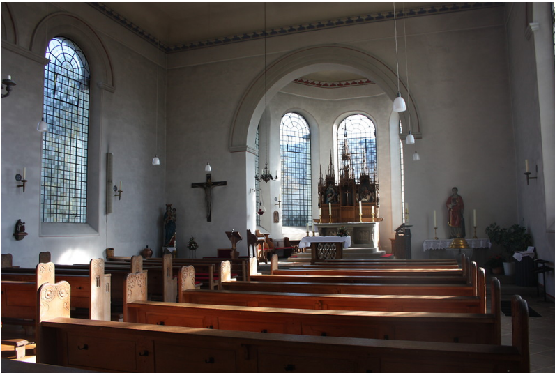
Innenraum von St. Laurentius in Hohkeppel (2017)