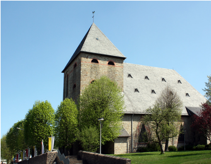
Die Katholische Pfarrkirche Sankt Apollinaris in Lindlar-Frielingsdorf (2009)