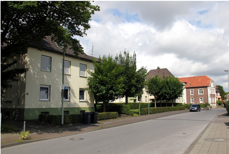
Die Eygelshovener Straße in Herzogenrath (2016)