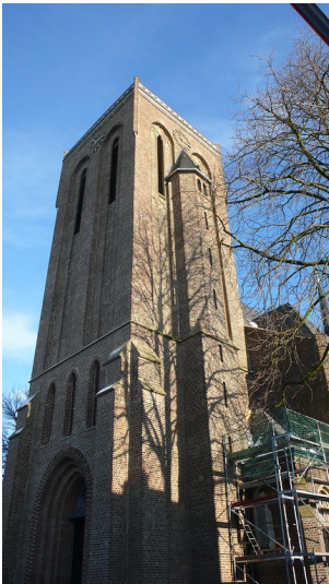
Katholische Pfarrkirche St. Lucia in Würselen-Broichweiden (2009)