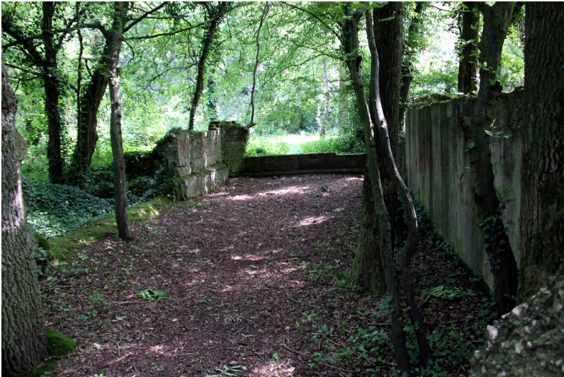
Baureste eines Grubengebäudes im Naturpark Worm-Wildnis bei Herzogenrath (2016)