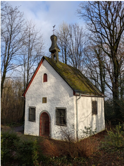
Johanneskapelle in Lindlar-Voßbruch (2024).