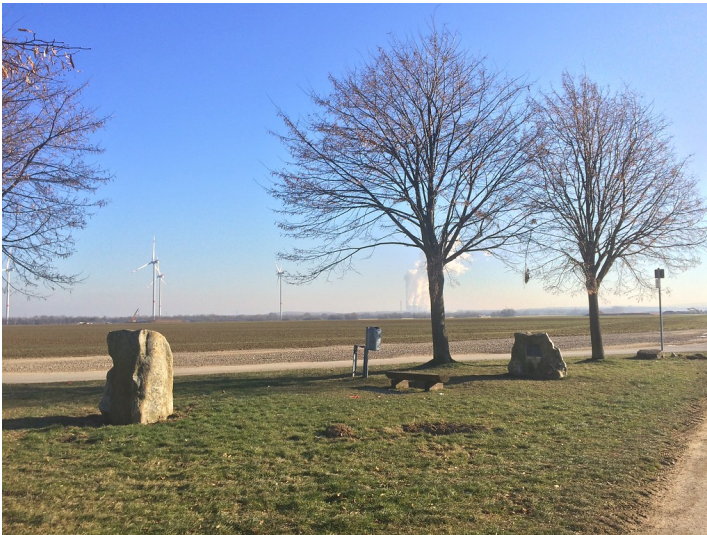
Blick auf die beiden Gedenksteine zur Erinnerung an das Dorf Langweiler (2017)