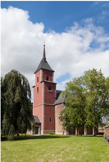
Aldenhoven-Siersdorf, Kath. Kirche St. Johannes