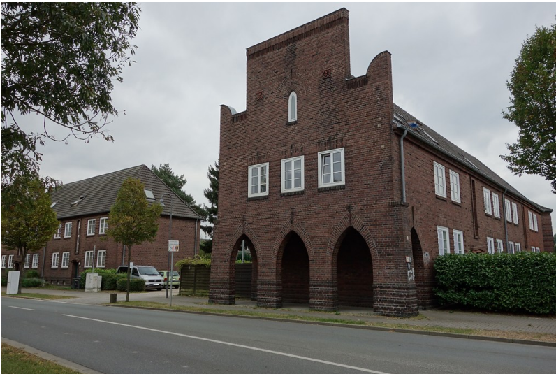
Siedlung Repelen (2016)