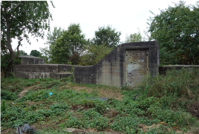
Tiefbunker an der Herzogstraße (2016)