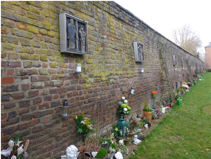
Friedhofsmauer (2017)