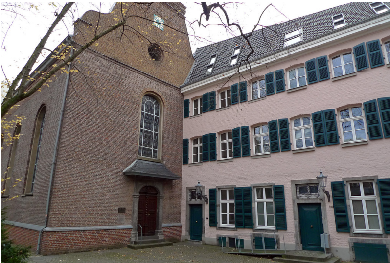
Berger Kirche in Düsseldorf (2016)