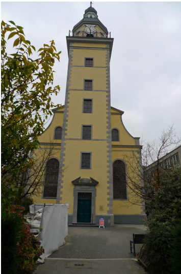
Evangelische Neanderkirche in Düsseldorf (2016)