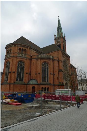
Evangelische Johanneskirche Düsseldorf