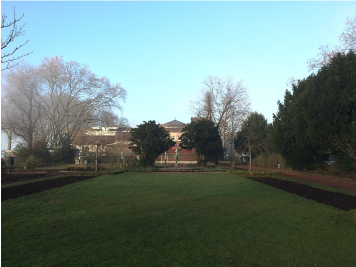
Rheingärtchen am Rheinufer in Düsseldorf (2016)