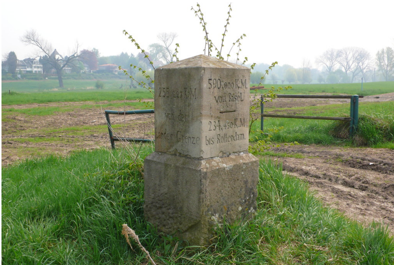
Myriameterstein bei Wittlaer