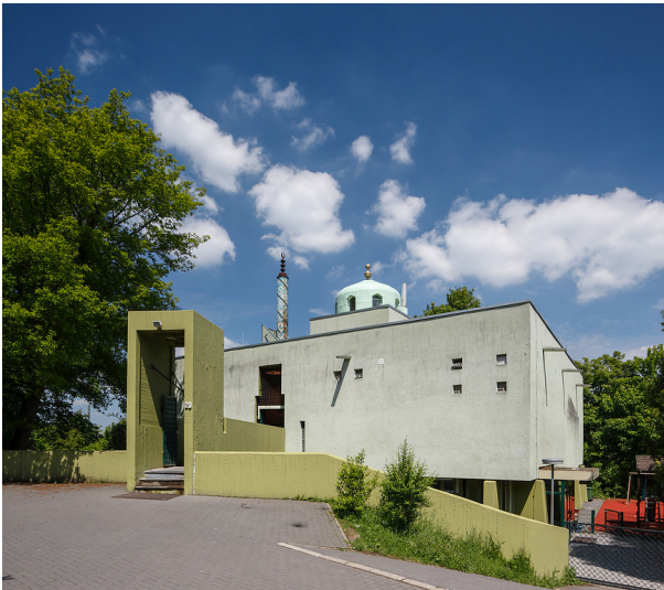
Bilal-Moschee in Aachen (2013)