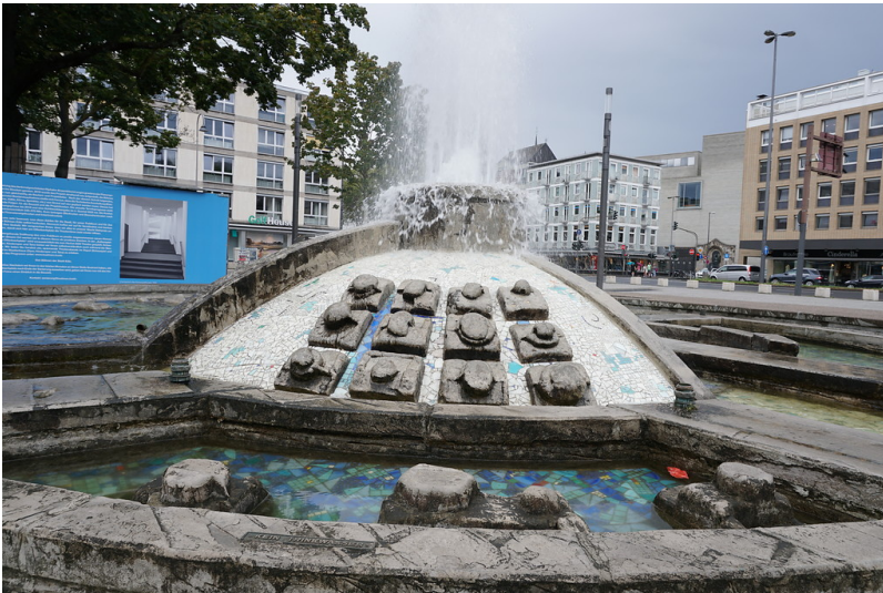
Opernbrunnen am Offenbachplatz (2019)