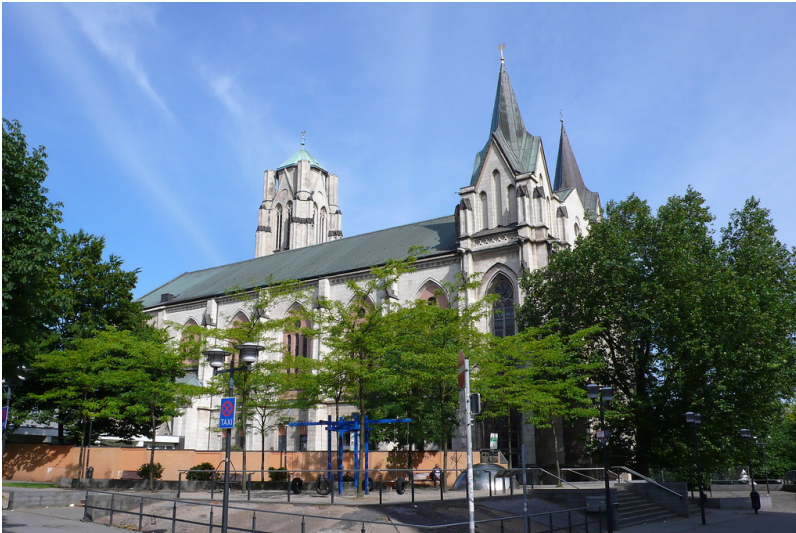
Katholische Pfarrkirche St. Gertrud in Essen (2009)