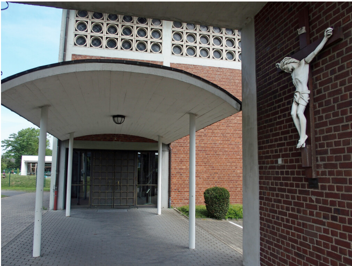
Mariä Himmelfahrt Langenfeld