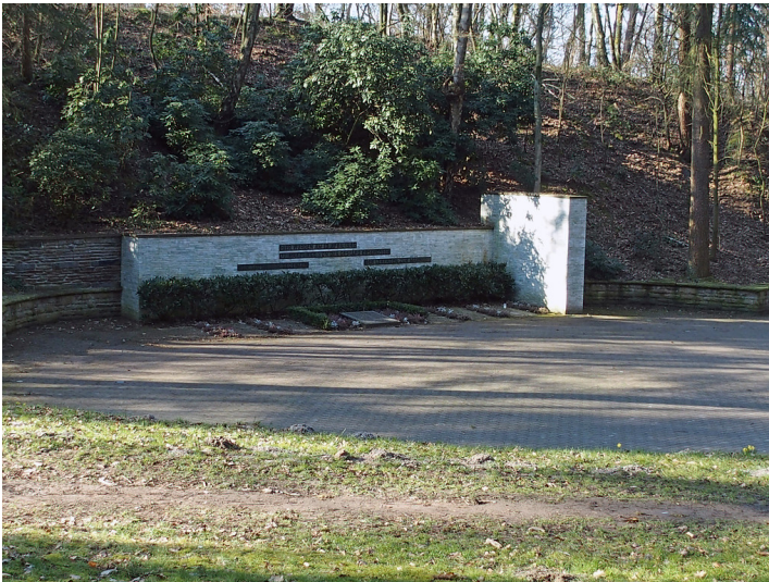
Mahnmal Wenzelnberg in Langenfeld (2016)