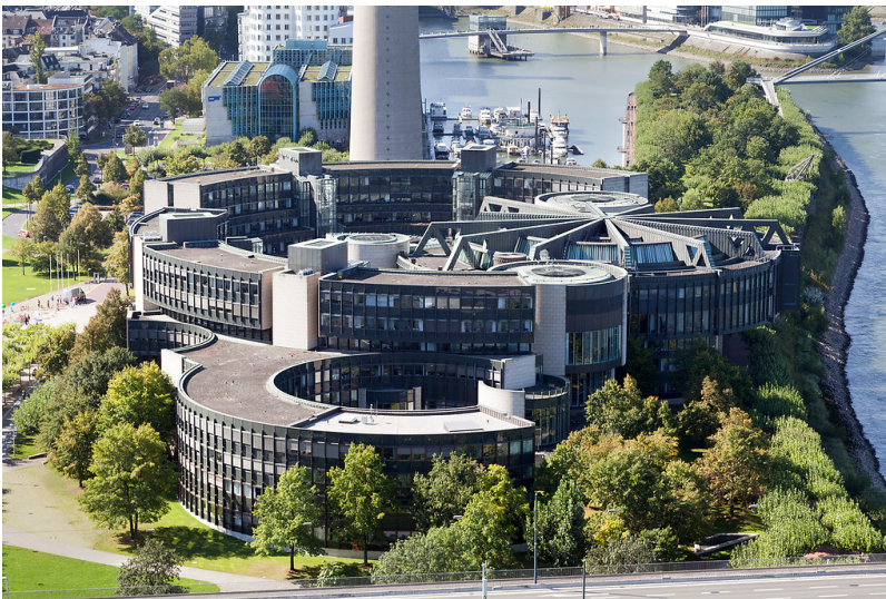
Düsseldorf-Unterbilk, Landtag