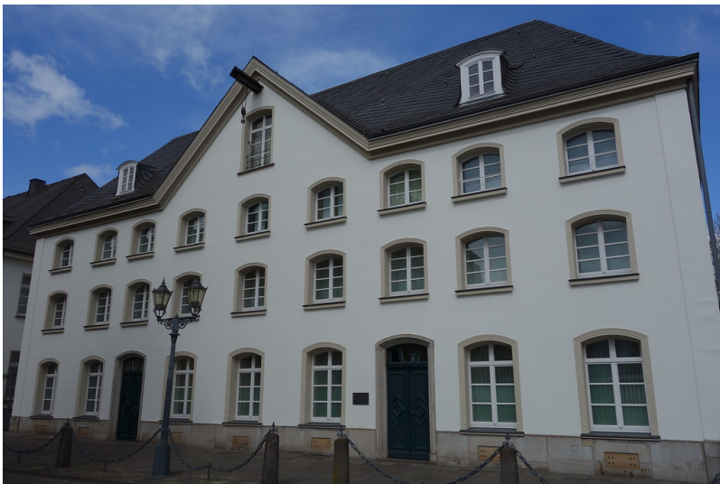
Haniel-Stammhaus in Duisburg (2016)