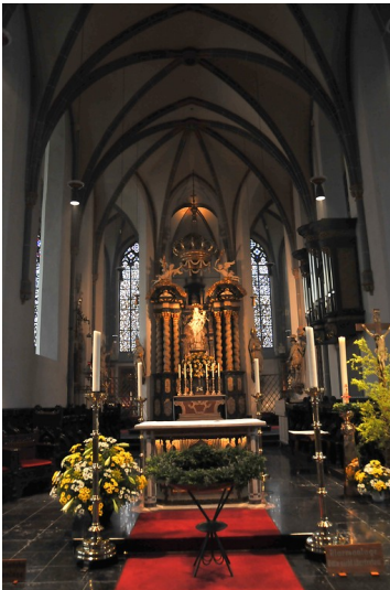
Hochaltar in der katholischen Kirche St. Lambertus in Düsseldorf (2009) Fotograf/Urheber: Karl-Heinz Flinspach