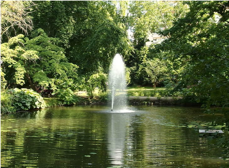
See mit Wasserfontäne im Malkastenpark in Düsseldorf (2015)