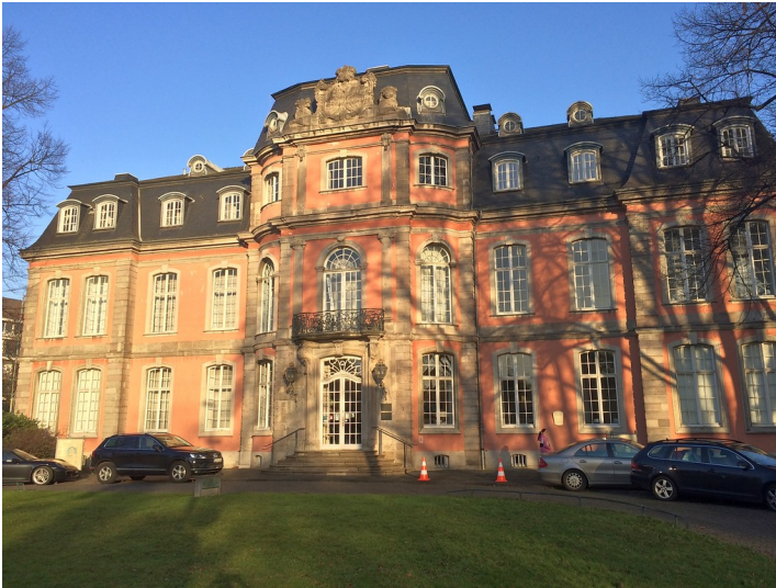
Schloss Jägerhof im Düsseldorfer Stadtteil Pempelfort (2016)