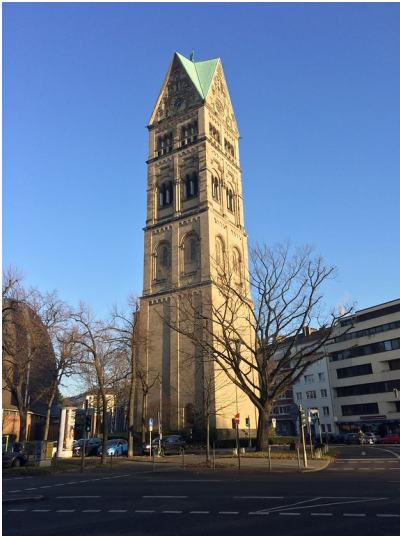
Turm der Rochuskirche in Düsseldorf-Pempelfort (2016)