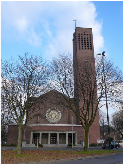
Katholische Kirche St. Franziskus Xavierius in Düsseldorf-Mörsenbroich (2009)