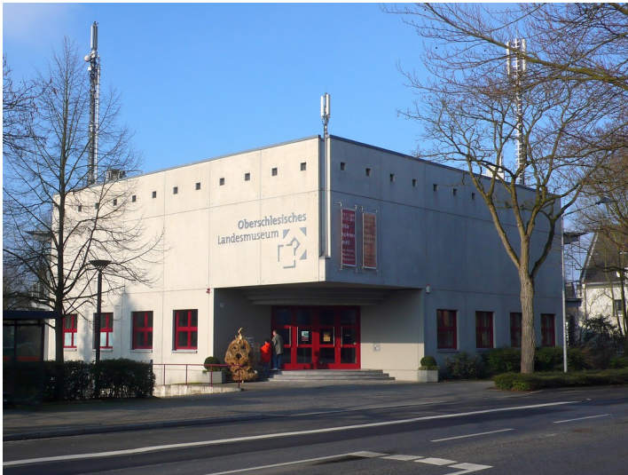
Oberschlesisches Landesmuseum in Ratingen-Hösel (2009)