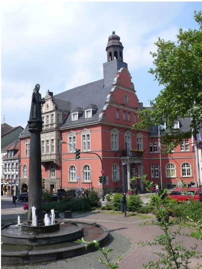
Rathaus von Essen-Werden