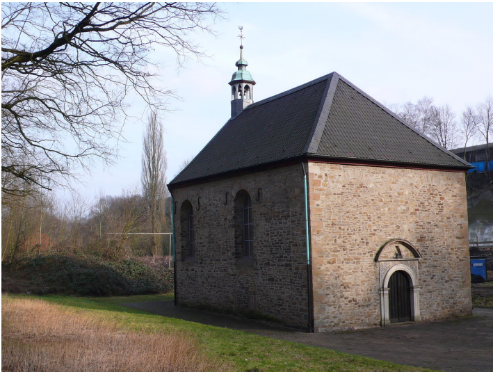
Sankt Annenkapelle in Essen-Rellinghausen (2009)