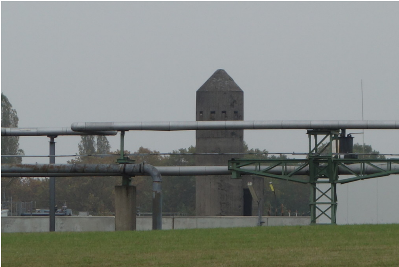
Hochbunker auf dem Gelände der INEOS in Moers (2016)