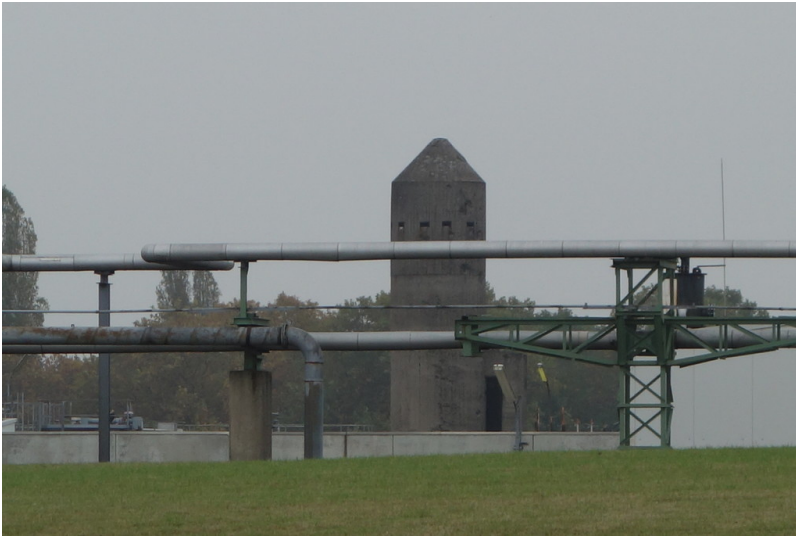
Hochbunker auf dem Gelände der INEOS in Moers (2016)