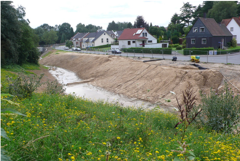
Ahbach in Bochum-Engelsburg (2009)