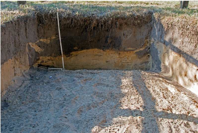
Bodenprofil eines Plaggeneschs (2016)