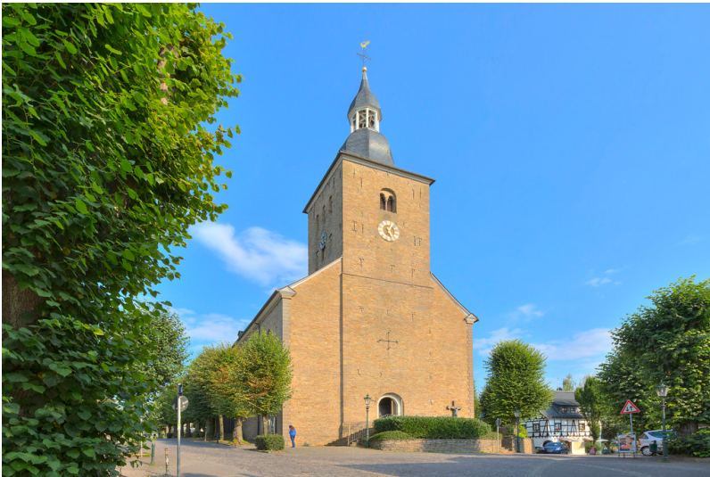
Die Katholische Pfarrkirche St. Severin in Lindlar (2013).