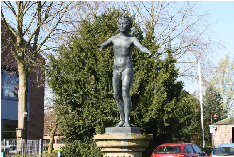
Abguss der römischen Bronze-Statue des "Lüttinger Knaben" an der Pantaleonstraße in Xanten-Lüttingen (2017).