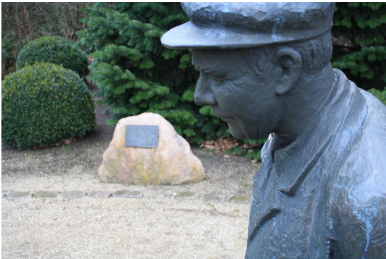
Nahaufnahme der Bronzestatue des Besenbinders in der Winnenthaler Straße, Denkmal für den letzten Besenbinder in Alpen (2017).