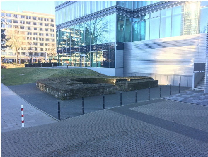
Konservierte Reste des Osttores des römischen Kastells Divitia in Köln-Deutz (2016)