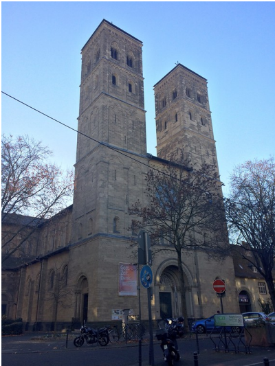
Kirche Neu St. Heribert in Köln-Deutz (2016)