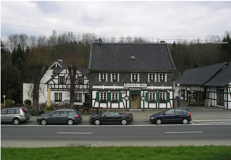
Fachwerkhofanlage Altenbrücker Mühle in Overath-Altenbrück (2007)