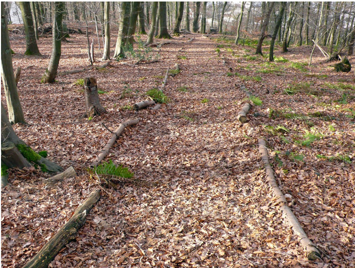
Waldweg nahe der Ortschaft Burg (2007)