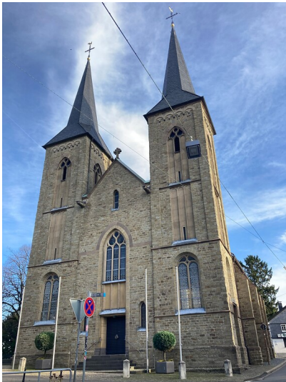
Wallfahrtskirche Sankt Mariä Heimsuchung in Overath-Marialinden (2021)